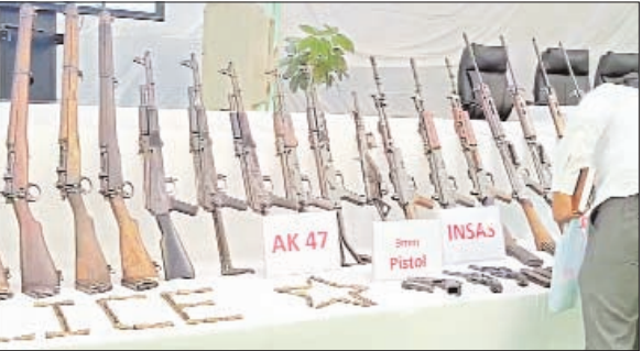
లొంగిపోయిన మావోయిస్టులు తమ వెంట తెచ్చిన సుమారు 40