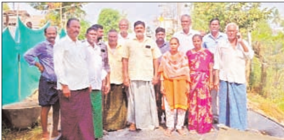
తెలుగుదేశం కాంగ్రెస్ పార్టీ నాయకులు పాల్గొన్నారు.