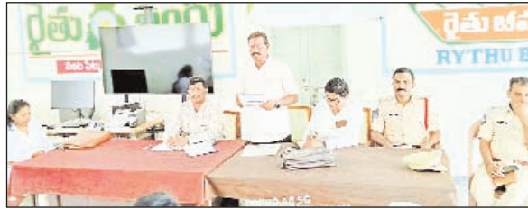
ప్రజా పాలన ప్రగతి ప్రణాళికలో భాగంగా ఏప్రిల్ 13 నుండి 18 వరకు “అరైవ్ అరైవ్” రోడ్డు భద్రతా వారోత్సవాల సందర్భంగా శుక్రవారం మండల కేంద్రంలోని రైతు వేదిక లో అశ్వాపురం మండల అధికారులు