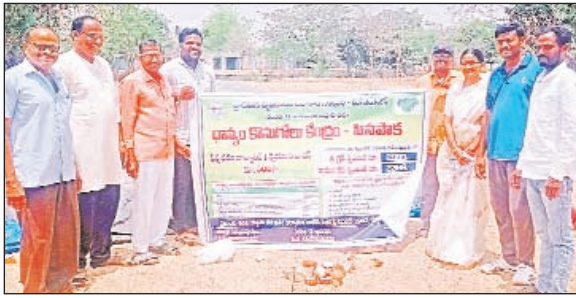
చేసుకోవాలని కోరారు. కొనుగోలు కేంద్రంతో త్వరితగతిన ధాన్యం కొనుగోలు జరిగేలా చర్యలు తీసుకుంటామని అధికారులు తెలిపారు. కార్యక్రమంలో వ్యవసాయ అధికారులు, గ్రామ పెద్దలు, నాయకులు పాల్గొన్నారు.